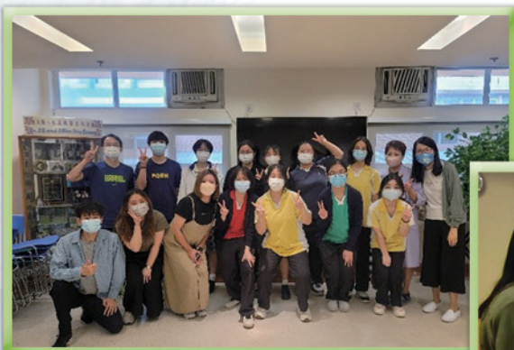
基督教聖約教會堅樂中學師生到本院受訓及探訪院友