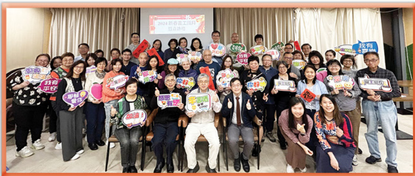
2024 新春義工團拜暨嘉許禮