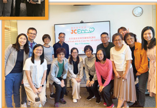
義工接受訓練，投身社區生死教育工作。