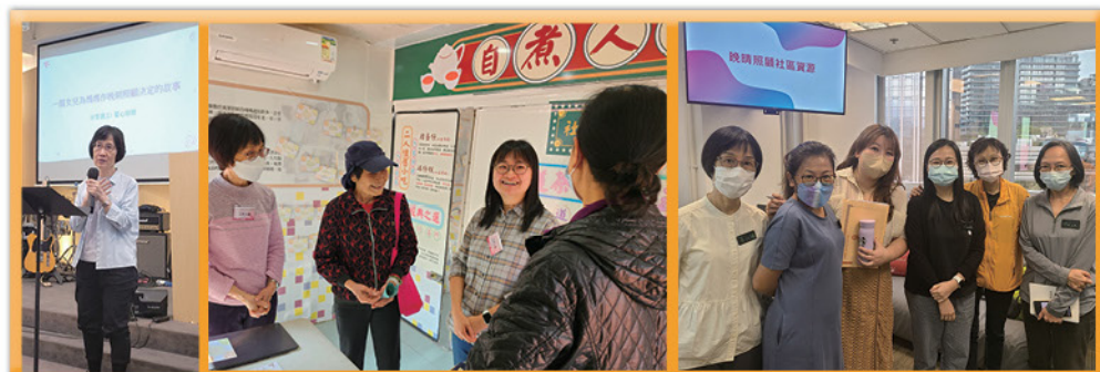
伙拍寧養院社工到教會、機構及社區，分享晚晴關懷知識及經驗。