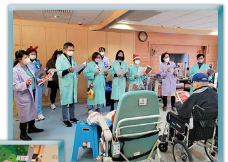
綠色義工袍是院內義工的標記！