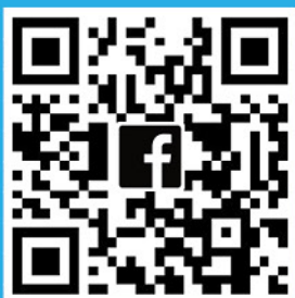
SASHCC Facebook QR code