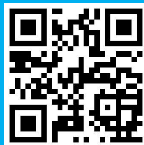
SASHCC website QR code

地址：新界將軍澳靈實路 19-21 號 電話：2703 3000 傳真：2703 5588 網頁： hohcshcc.org.hk 電郵地址： sashcc@hohcs.org.hk Facebook： facebook.com/SASHCC/