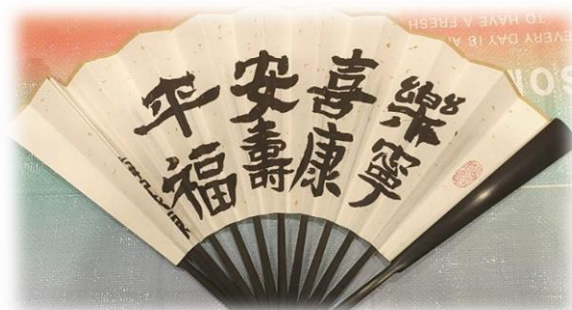
鄭傳道送贈金句木架（左）給同學，同學也以親筆書法扇（上）作回禮，彼此祝福及鼓勵！