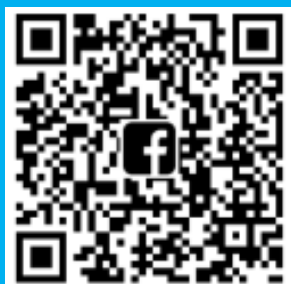
SASHCC Facebook QR code