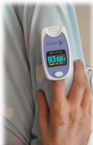
護士於家訪時為華嫂做身體檢查

照顧員之後每週到訪為華嫂抹身洗髮。第一次抹身後，照顧員問她的感覺如何，她鏗鏘地回答：「我很舒服，多謝你們。」華嫂卧床時間漸漸地減少了。中午時段都喜愛坐在廳中，可以早些吃午餐，也多了時間陪伴丈夫。丈夫藉此和她細數從前，道愛道謝。一天，不多言語的華嫂突然地向丈夫說，感恩有他，多謝他多年相伴。華哥向我覆述這句話時，泣不成聲。