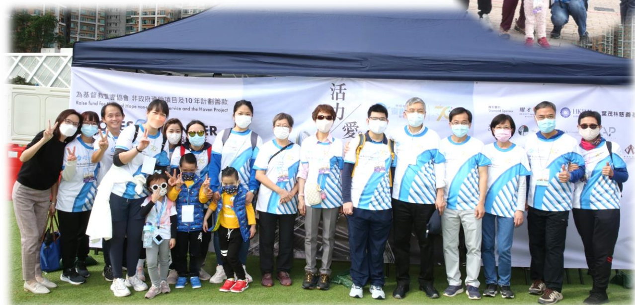
寧養院的同工、前院友家屬連同家人同心響應支持「2023 HOPES RUNNER 靈實生命跑及慈善行」。

是次活動是為靈實非政府資助服務及 10 年計劃籌款，當中包括「寧養院擴建計劃」，感謝各善長的愛心支持，讓更多有需要的病人及家屬得到幫助！繼續禱告記念擴建計劃的進行，求主賜團隊智慧解決各種困難，並供應所需款項，致使第一期的安寧照顧大樓能如期在 2026 年落成。