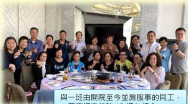
與一班由開院至今並肩服事的同工，一同慶祝寧養院 13 週年紀念

在此，感謝每一位同工的用心服事，特別是一班由開院至今仍緊守崗位的同工們，將他們人生當中最寶貴的十年甚或更多，貢獻給寧養院。在 13 週年紀念日當天，我和黃副院長宴請這些同工一起午膳，答謝他們多年來的付出。適逢當天也是感恩節，一班同工聚首細說當年，數算主恩，別具意義。席間有個別同工應邀分享他們在工作上的體會：有的分享在寧養院學習信心及謙卑的功課；有的親歷團隊合作的精神，互相扶持的可貴；有的見證寧養院的成長，現踏入「青年期」，願意一同攜手努力，讓寧養院成為更多人的幫助。亦有同工深深感受工作的意義及滿足感，承諾會一直在寧養院工作。這些點滴都令我和黃副院長非常感動。從整個團隊的並肩服事中，我看見神的愛，亦深信這份愛能激勵我們繼續全心投入「用愛擁抱晚晴」的事工。