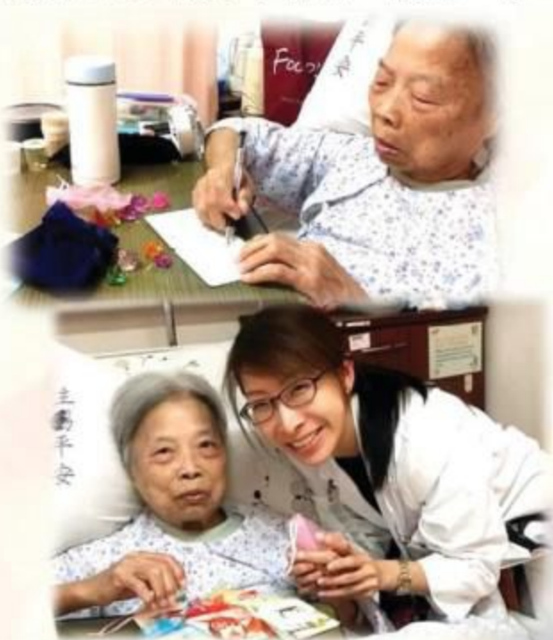
出院前，與主診醫生合力製作小手工，向女兒表達謝意。

陳婆婆堅毅的生命，努力不懈的精神，實在令人敬佩，也成為小記者的榜樣呢！（希望下次再見，承你貴言，減肥成功！）