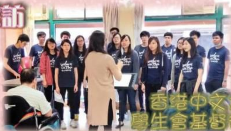
香港中文大學 學生會基督徒詩班