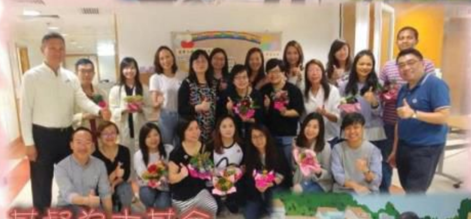
基督為本基金 義工隊