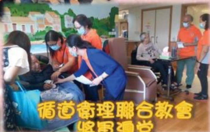
循道衛理聯合教會 將軍澳堂