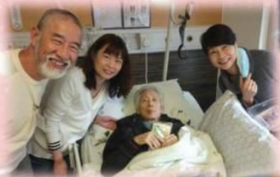
彩虹團契： 家屬義工隊