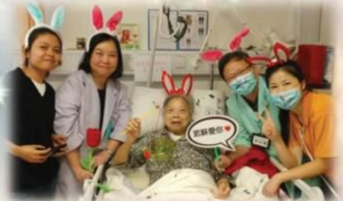
住院期間，參與不同活動，例如：音樂治療及中秋慶祝會等。